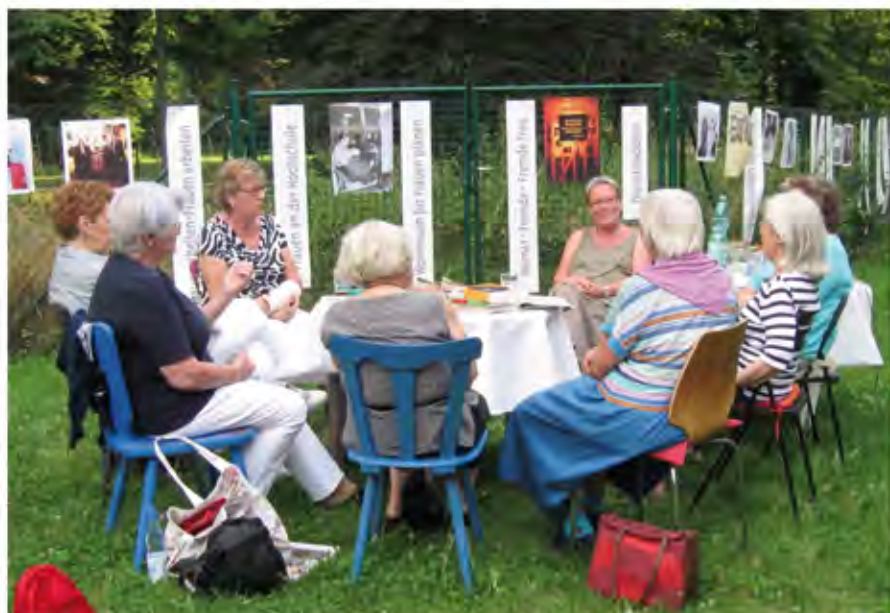
Erzählrunde: „Was lesen Frauen heute“