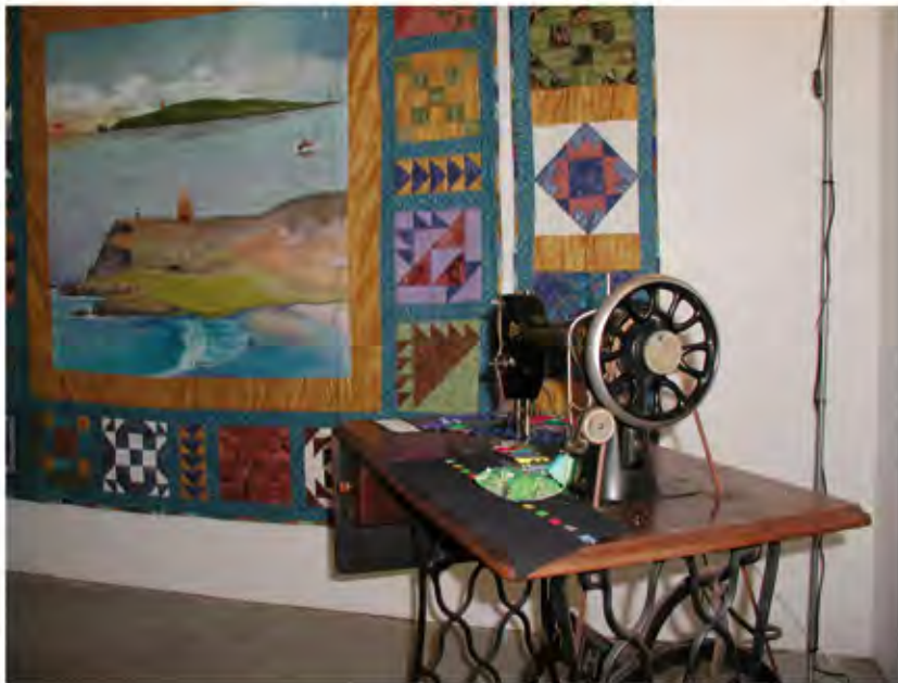
Quilt: „Liebe, die das Meer überwindet“. Gemeinschaftswerk von Frauen der Insel Arranmore und Tir Boghaine

Politische Beteiligung, bürgerliche Freiheiten, demokratische Verfassungen und Menschenrechte müssen bis heute immer wieder neu von Frauen erstritten werden. Mit ihrer Textilkunst legen sie von ihren Kämpfen und Träumen grenzüberschreitend Zeugnis ab.