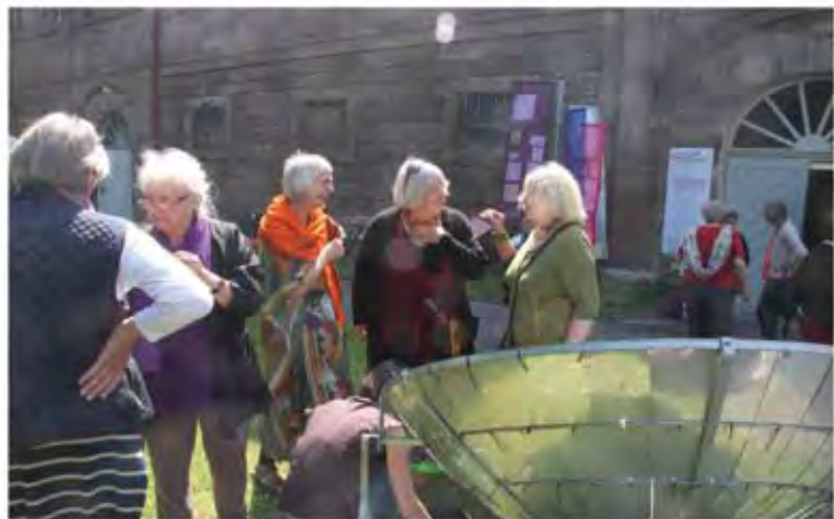
Gespräche beim Kaffee aus dem Solarkocher