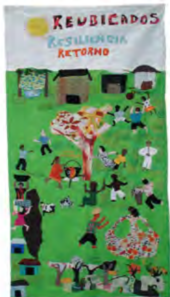
Sie zeigen die Hoffnung auf die Rückkehr (REUBICADOS, RESILIENCIA, RETORNO). 72 x 140 cm

Die starken Frauen von Mampujan, so haben wir die Frauen in unserer Ausstellung „Sehen und gesehen werden“ genannt, die im Jahr 2000 durch ein Massaker aus ihrem Dorf vertrieben wurden und auf juristischer Ebene, aber auch mit ihren Erzählungen auf Wandteppichen das Unrecht gegen die afro-kolumbianische Bevölkerung anklagen.