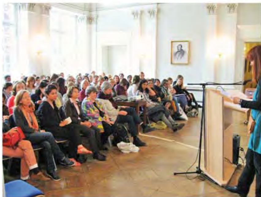
Auftakt der Ausstellung 2015 im Festsaal Schloss Burgfarrnbach