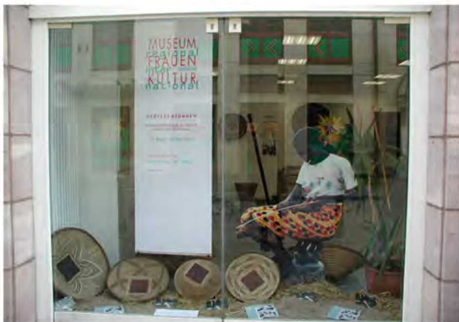
Verflechtungen, Ausstellung in der Alexanderstraße 8 in Fürth