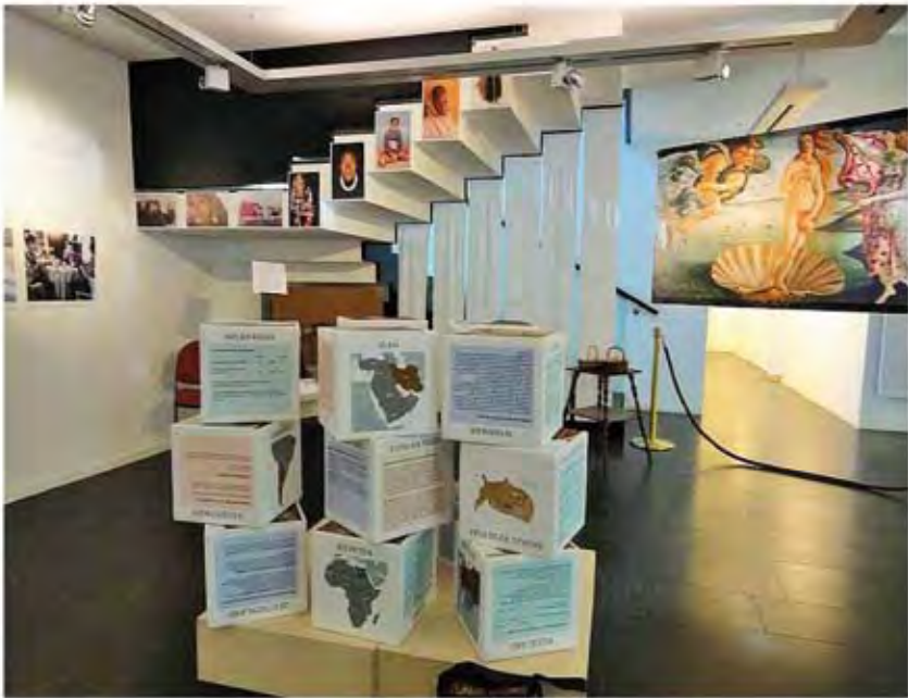
Gewonnene Jahre im Frauenmuseum Meran 2015/2016 Kopftuchkulturen im Frauenmuseum Hittisau 2006