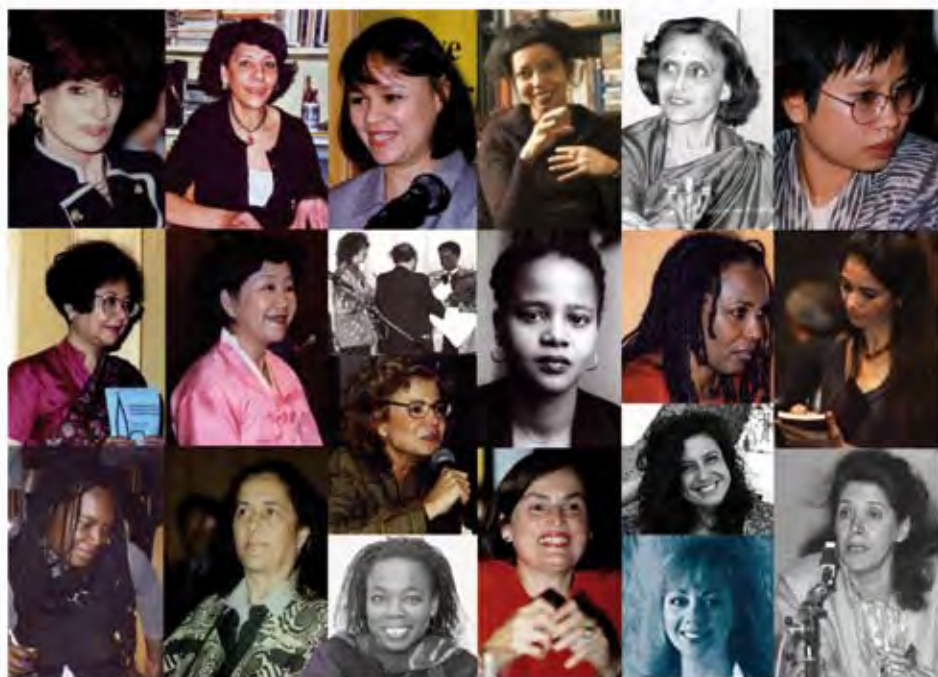
Zwanzig Literaturpreisträgerinnen im Museum Frauenkultur Regional – International