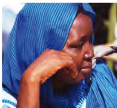
Kopftuchkulturen: Panama, Tschad, Guatemala, Franken