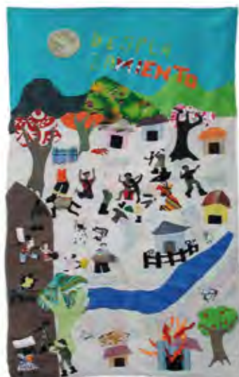
Die applizierten Wandbehänge der Frauen von Mampuján zeigen die Zerstörung des Dorfes und die Vertreibung (DESPLAZAMIENTO). 72 x 130 cm

Wir machen Bilder über das „Fremde“ oder „fremde Frauen“ sichtbar und regen zu neuen Fragen an.