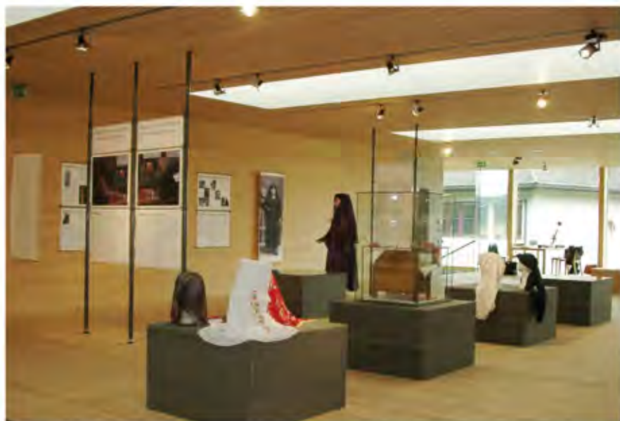
Blick in die Ausstellung „Kopftuchkulturen“ 2005 im Frauenmuseum Hittisau