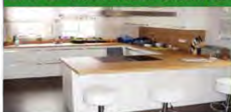
Möbel · Küchen · Fußböden · Innenausbau

Selbst schwierigste Raumsituationen werden dank durchdachter Maßanfertigung spielend gelöst.