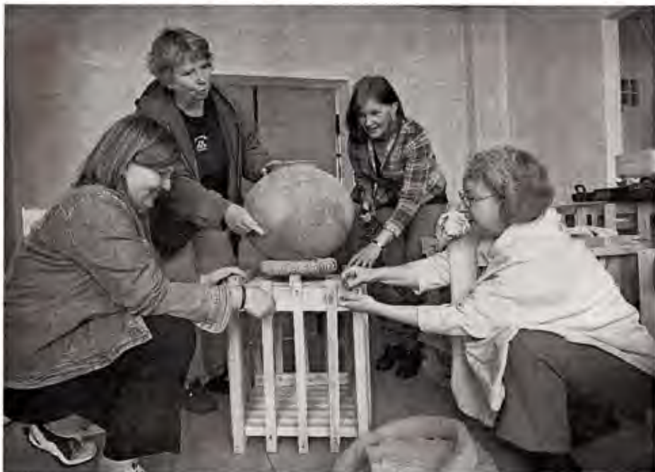
Im Laden Nürnberger Straße 2 bereiten Eine-Welt-Frauen die Ausstellung vor.

Start ist am 10. Mai in der Nürnberger Straße mit einer Schau über Bierbrauerinnen