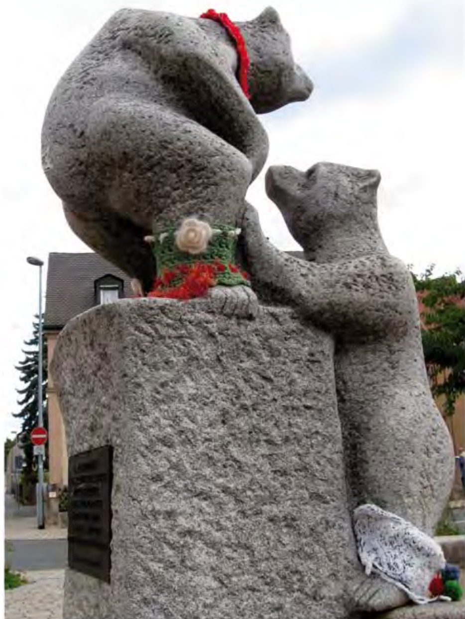
Die besockten Bären von Burgfarrnbach