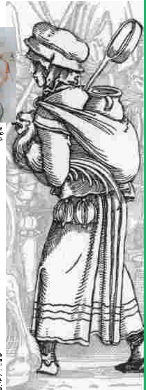
Mit Sack und Pack beladen zogen Frauen in der Frühen Neuzeit zur Versorgung der Heere mit. Detail aus Sebald Beham, "Der Heerestroß", um 1530