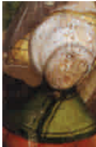
Eine Spitalmeisterin, Ausschnitt aus dem Altarflügel der St. Wolfgangskirche in Rothenburg o. d. T., 15. Jahrhundert

2000 Jahre Geschichte vor der eigenen Haustüre sichtbar gemacht! Alltag, kulturelles Wirken und politische Taten von Frauen verschiedener Klassen und Herkunft werden lebendig: Unbekannte Werke bedeutender Wissenschaftlerinnen und Künstlerinnen, Inszenierungen aus Arbeitsleben und dörflicher Modewelt und persönliche Erinnerungstücke werfen ein ganz besonderes Licht auf politische Ereignisse.