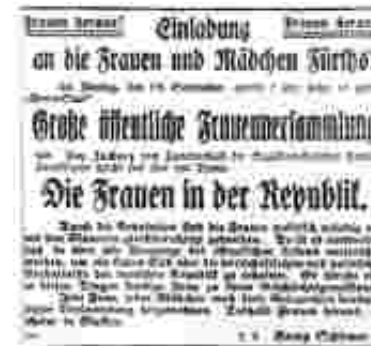
Fränkische Tagespost 1919