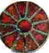
Almandinfibel, Schmuck der Fränkinnen im 6. Jh. n. Chr.

»Fremdartig«: Die Region hat immer wieder neue Kulturen aufgenommen und integriert. Römerinnen und Fränkinnen, Angelsächsinen, Exulantinnen und Hugenottinnen, Flüchtlingsfrauen und Migrantinnen des 20. Jahrhunderts - sie alle gestalteten die Geschichte Mittelfrankens mit.