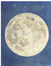
Monddarstellung der Nürnberger Astronomin Maria Clara Eimmart (1676-1707)

»Neuartig«: Frauen haben - nicht immer zeitgleich mit den Männern - ebenso Neues ausprobiert und geschaffen. Wesentlichen Anteil an der gesellschaftlichen, politischen und kulturellen Entwicklung hatten berufstätige, heilkundige Frauen in den mittelalterlichen Städten, Markgräfinnen und Mätressen in Barock und Aufklärung, Studentinnen und Politikerinnen des 20. Jahrhunderts.