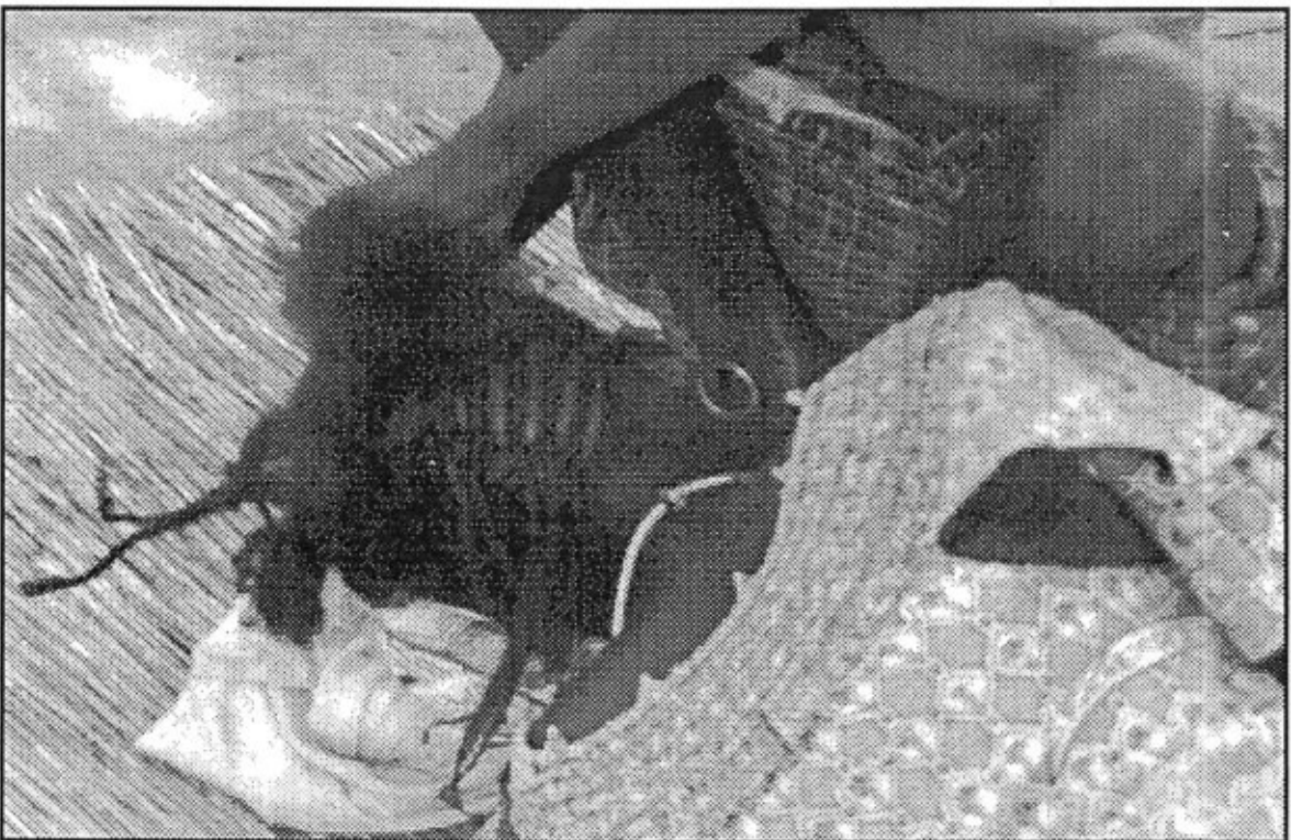
In stundenlanger Arbeit flechten sich Peulh-Frauen neue Zöpfchen